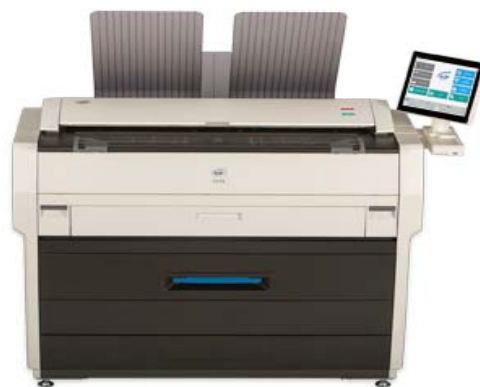
Моноблочная многофункциональная система KIP7170