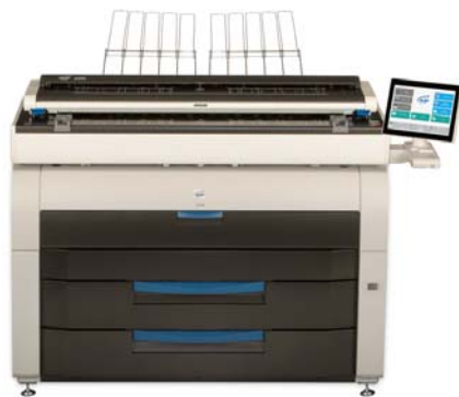
Производительная многофункциональная система KIP7970 с сканером KIP2300