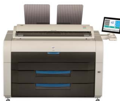
Производительная многофункциональная система KIP7970 с сканером KIP720