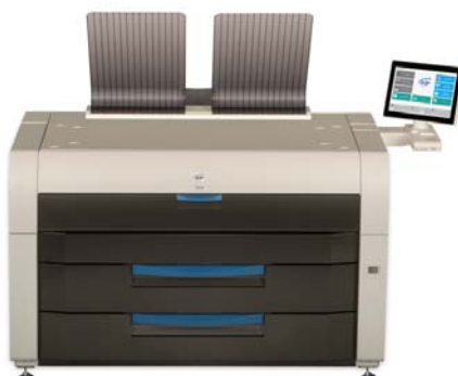
Производительная система сетевой печати KIP7970